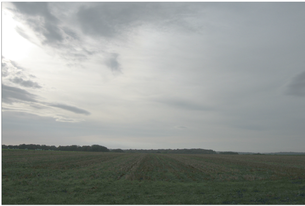
Eolienne n° 5 : Vue avant implantation