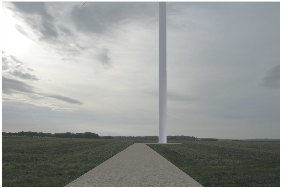
Eolienne n° 5 : Vue après implantation